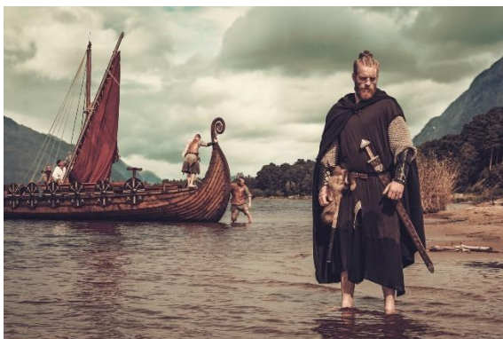
Slika 3