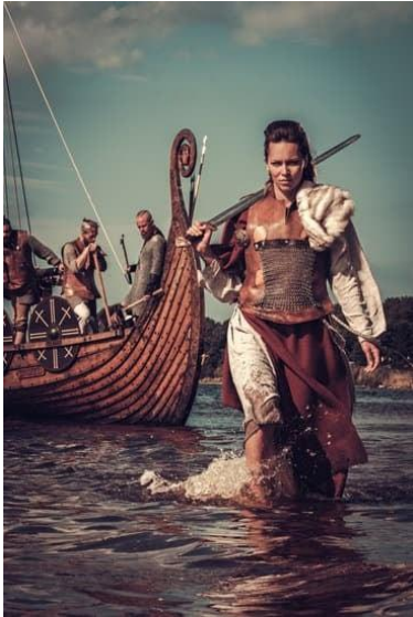
Figure 4