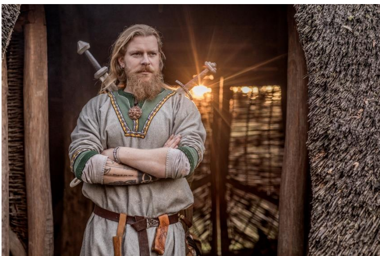
Figure 6