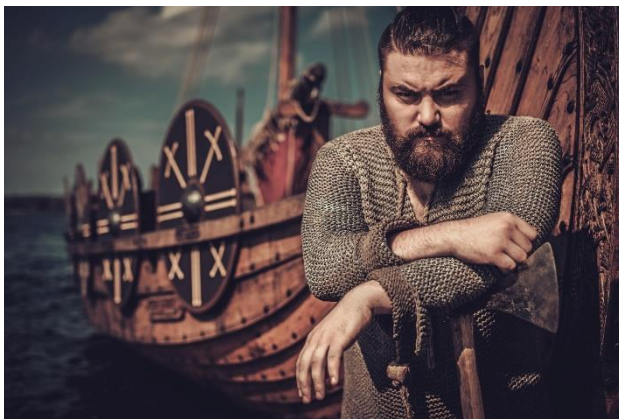
Slika 5