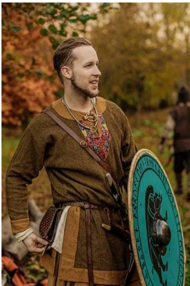
Figure 2