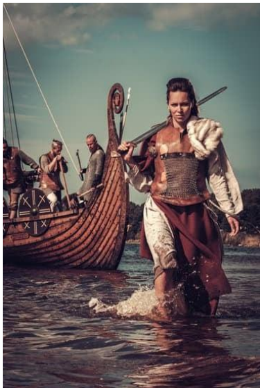
Slika 4