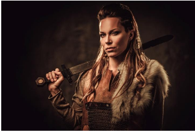
Slika 1